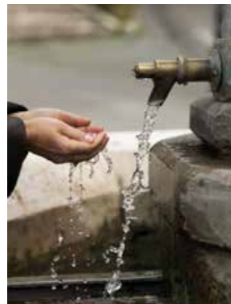
Charlie Drevstam. Getty Images

La Terra ofereix unes condicions idònies que hi fan possible la vida i, entre aquestes, ocupa un lloc destacat la presència d'aigua líquida en la seva superfície. Gràcies a això i a les extraordinàries propietats físiques de l'aigua, existim.