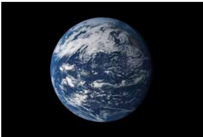
Terra, oceà Pacífic.